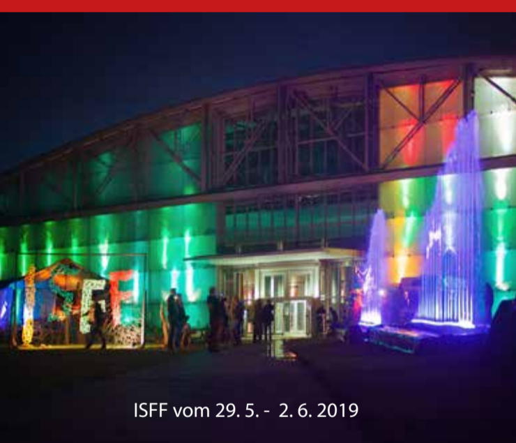
ISFF vom 29. 5. - 2. 6. 2019